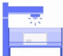
Столы с камерами и софитами