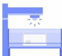
Столы с камерами и софитами