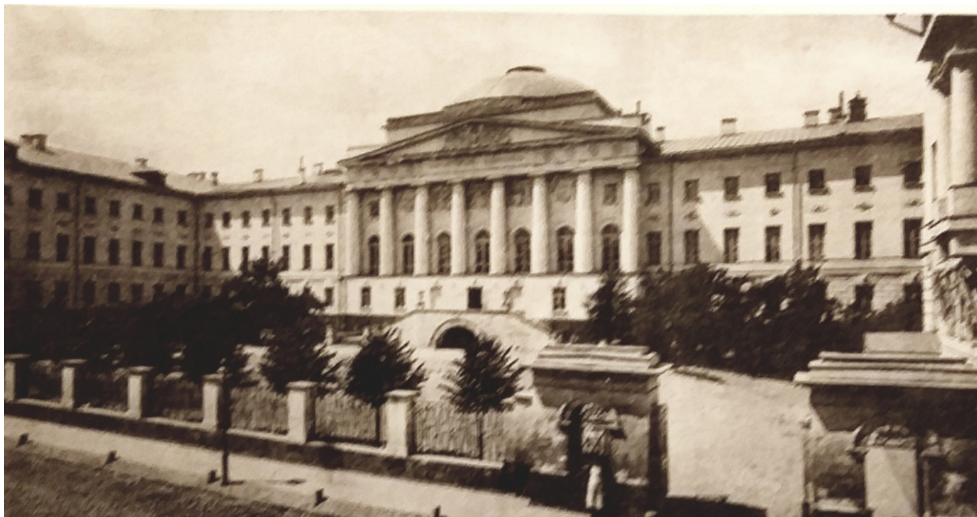
Здание Московского университета. 1916 г.

В ведомстве хранится собрание документов главного вуза столицы, начиная с 60-х годов XVIII века.