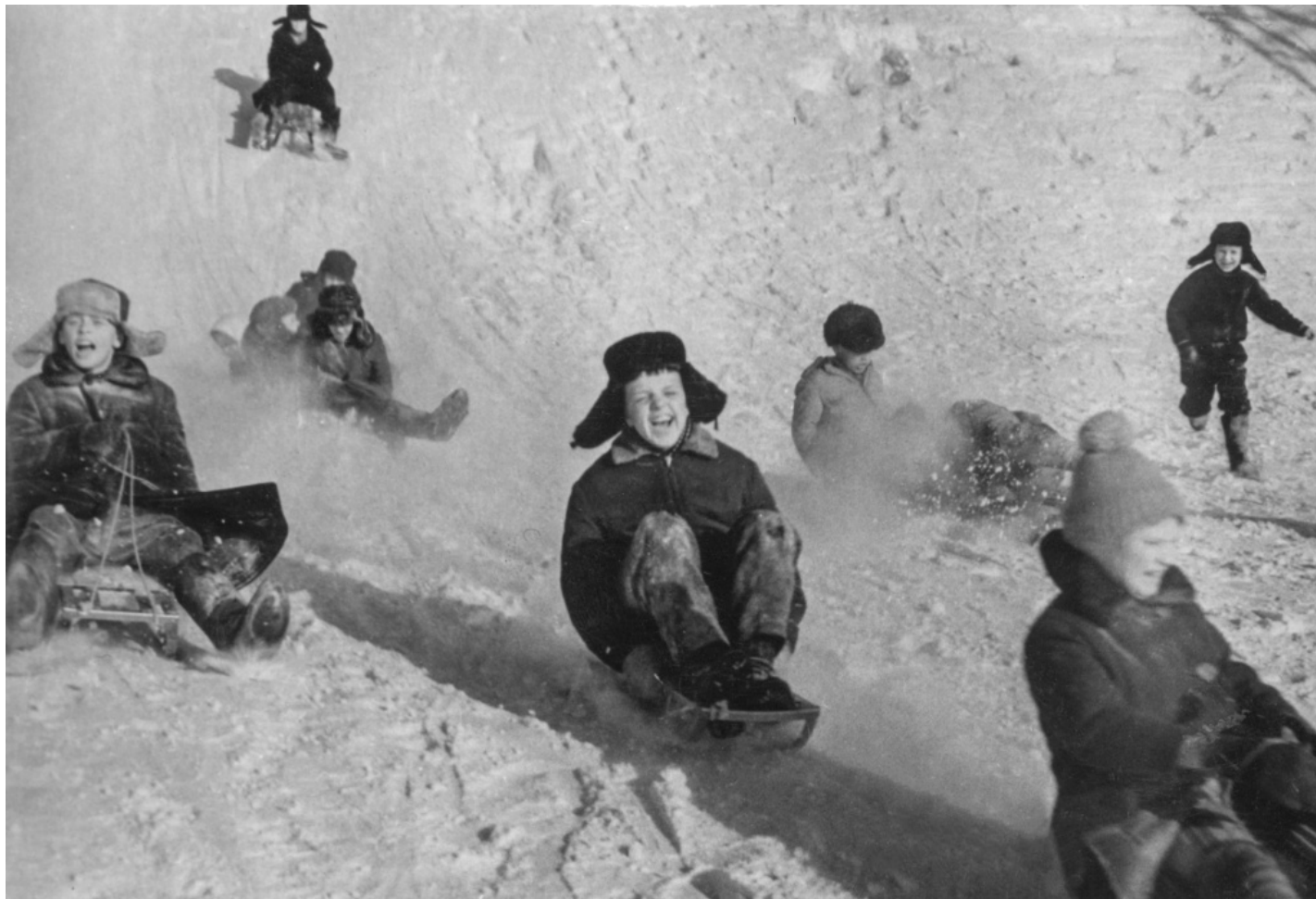
Катание с гор. Москва. Февраль 1967 г.