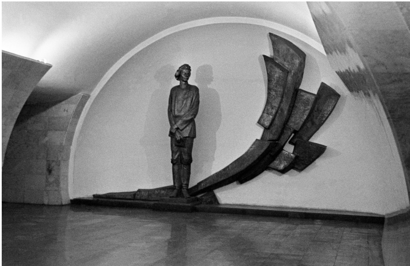
Скульптура писателя А.М. Горького в вестибюле станции метро «Горьковская». Фото Е. Самойлова. Москва. 1980 г. Главархив Москвы.

24 марта 1959 года вышел приказ начальника Московского метрополитена Александра Ежова об обеспечении охраны памятников искусства метро. Главархив Москвы публикует этот документ.