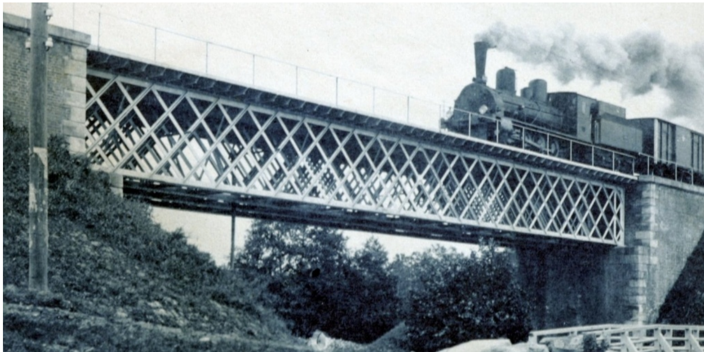
Железнодорожный мост с идущим по нему поездом. Автор А. Гаврилов. Начало XX века. Главархив Москвы

Читатели смогут узнать, как ловили безбилетников и боролись с курильщиками в конце XIX — начале XX века, о цене на проезд, льготах и многом другом.