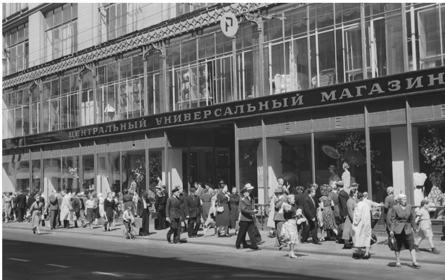
У входа в ЦУМ. 15 июня 1956 года.

Магазин открылся и стал очень популярным. 9 декабря 1933 года Моссовет выпустил еще одно постановление, согласно которому для ЦУМа устанавливалась так называемая прерывная рабочая неделя с выходными днями 1, 7, 13, 19, 25 или 31-го числа каждого месяца. В день, следующий после выходного, ЦУМ начинал работу в 12:00. В остальные дни торговля проходила с 10:00 до 19:00.