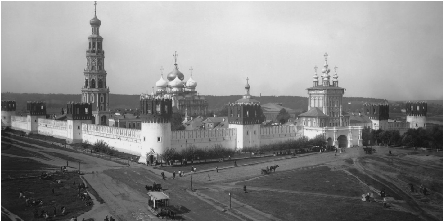
Вид на Богородице-Смоленский Новодевичий монастырь. Автор – П.П. Павлов. Москва. Конец XIX - начало XX вв. Главархив Москвы.