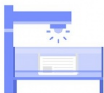
Столы с камерами и софитами